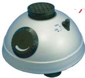
コニカルタイプアダプター (標準付属)